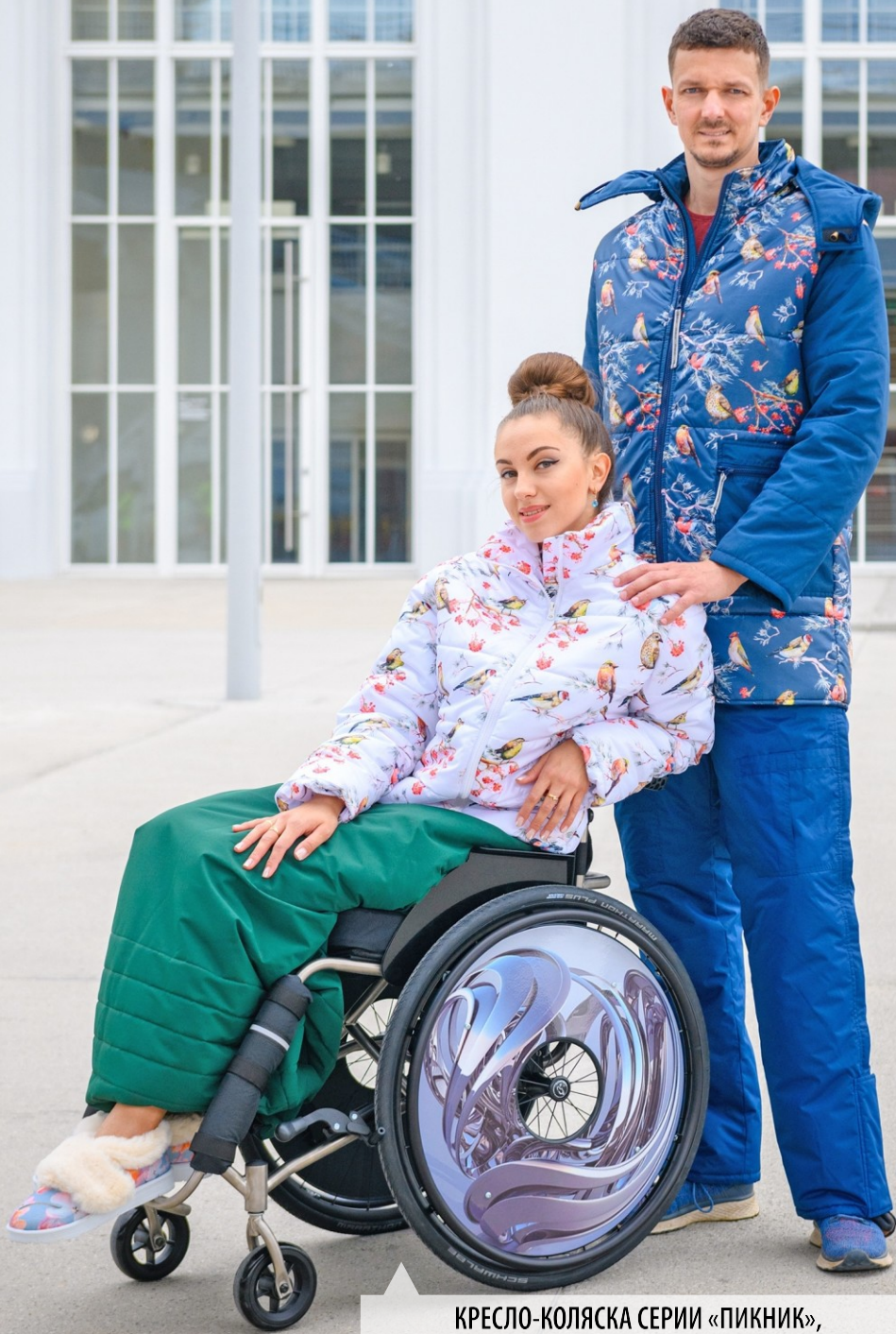
КРЕСЛО-КОЛЯСКА СЕРИИ «ПИКНИК», ПРОИЗВОДСТВО АНО «КАТАРЖИНА»